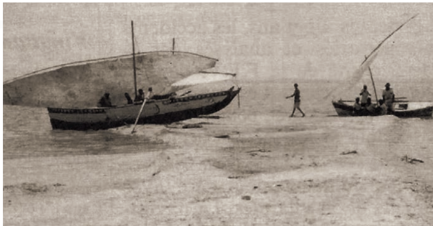
Echouage sur les dunes qui bordent la rive.

Nous allons nous déhaler de la côte et des affleurements rocheux à la rame, car aucune de ces barques n'a de moteur. Nous verrons tout-à-l'heure les pêcheurs s'arc-bouter sur leurs rames pour étaler leurs filets sur les lieux de pêche, puisqu'il semble que la voile ne serve que pour se déplacer d'un point à un autre. Lorsque nous sommes suffisamment