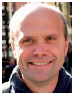
Par Pierre BLANC rédacteur en chef de Confluences Méditerranée

L'un des objectifs de la réforme de l'islam est de le dissocier de sa dimension politique