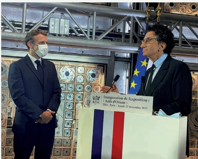
Emmanuel Macron et Jack Lang ouvrent l'exposition

Cette exposition se tiend à l'INA jusqu'au 13 mars 2022