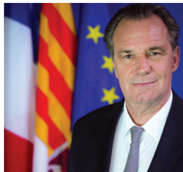
M. Renaud MUSELIER, Président de la Région Provence-Alpes-Côte d'Azur

Cette Rencontre est placée sous l'égide de