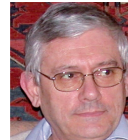
M. Jean-François COUSTILLIÈRE, contre-amiral (2S),

il effectue 36 ans de services dans la marine partagés entre les télécommunications, la Méditerranée et la conduite des opérations, y compris en interarmées.