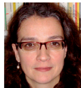
par Mme Isabel SCHÄFER • Allemagne

Ce développement est entre autres dû au moment de désorientation après les révoltes arabes en 2011, aux divergences internes et à l'insécurité sur les ordres politiques à venir. Mais les défis mentionnés n'attendent pas et ne suivent ni la logique ni le calendrier du monde politique. Il importe d'habiliter les acteurs des sociétés civiles, notamment la jeune génération, et de coopérer librement entre les deux rives et de développer des propositions concrètes.